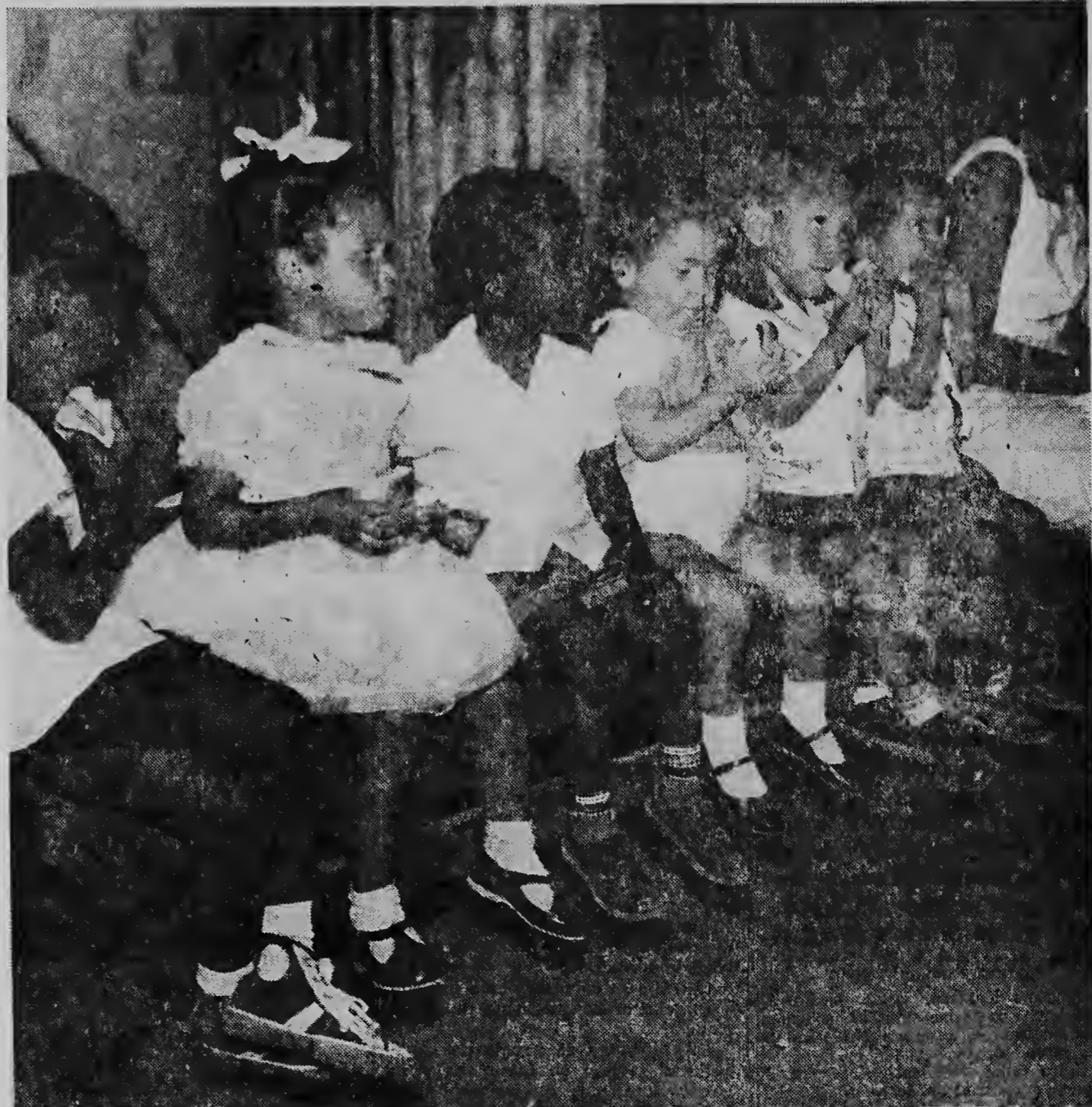
Coney Island dialuna anochi tabata na disposicion di e muchanan di Casa Cuna y Imeldahof. Aki nan a cansa di e cabaito y ta percura pa e stoma tambe hanja algo.